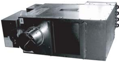
FDV 型并联式风机动力末端装置